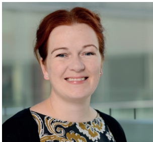
Oberbürgermeisterin Katja Dörner

https://pretix.eu/ihkbonn/ kooperation/ Anmeldeschluss: 27.05.2021